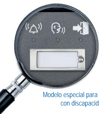
Modelo especial para personas con discapacidad