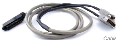
Cable Amphenol en "Y" opcional

*Hardware echo cancellation option required.